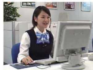
「はい、ご案内いたします」