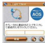
AOSのロゴが入ったISL Light起動画面

また、コマンドラインでビットマップファイルを指定することにより、ISL Lightの画面にAOSのロゴが出せる仕様も、助かります。