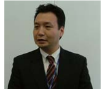
「ISL Lightは、ライセンスの体系がアパマンショップに合っています」

一方、ISL Lightの場合は、50店舗で使う場合でも、50ライセンス買う必要がありません。50店舗での同時接続を、仮に20と予測するならば、20ライセンスだけを買えばよい。同じ50店舗で使う場合でも、同時接続数単位のライセンス体系の方が、低コストで購入できます。