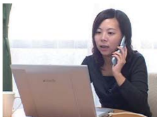
「WEB来店システムを使いたいのですが・・・」