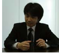
「起動時のコマンドラインオプションが豊富な点が良いと思います」

また、実行ファイルを起動する際に、コマンドライン・オプションを使って、さまざまな動作の初期設定が変更できる点も柔軟で良いと思います。