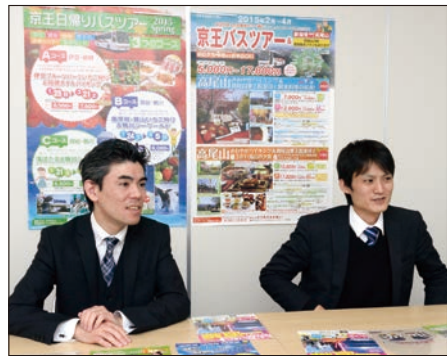
「リモート操作の様子を動画で残せる点にも興味を持ちました」

ISL Online は、「誰が」「いつ」「どの端末・サーバーをリモート操作したか」の証跡となるログも、リモート接続を中継するサーバーで一元的に取得できました。