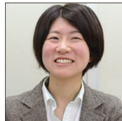
「こちら(=ISL Online)の方が速くつながりますね!」と、お客様からも言われます」(小原氏)

リモート接続が速く確立されるようになり、お客様をお待たせしなくて済むようになりました。ISL Online の方が、従来の他社製リモートコントロールツールよりも10秒は速くつながります。お客様からも、「こちら(=ISL Online)の方が速くつながりますね!」と言われます。