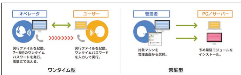
ワールド・ファミリーでは常駐型(右)で ISL Online を利用している